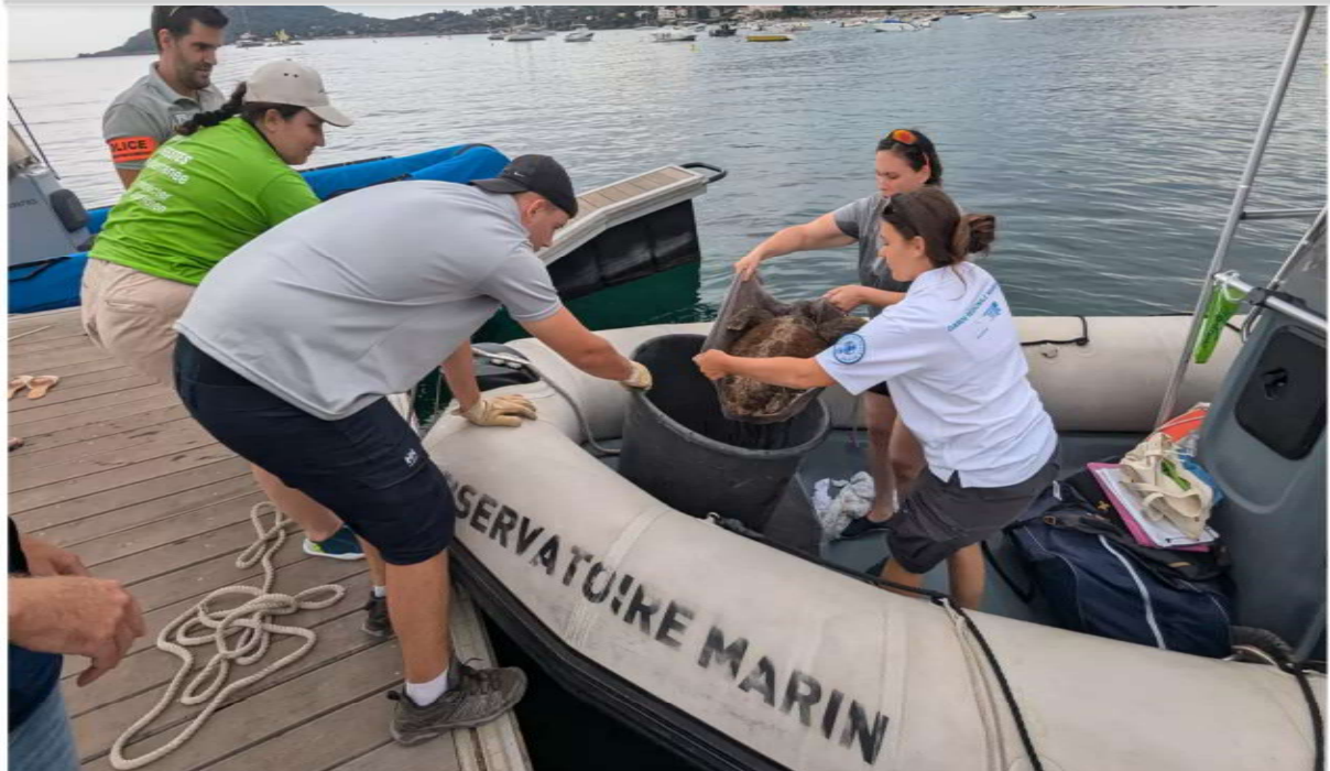
Entre deux échanges avec des plaisanciers, les membres de l'Observatoire marin de l'agglomération ont récupéré une tortue marine en perdition qui sera prochainement soignée au sein du centre de soins d'Antibes.

J.T. • Publié le 19/07/2024 à 22:42, mis à jour le 19/07/2024 à 22:42