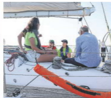
Les plaisanciers reçoivent les conseils des éco-gardes.