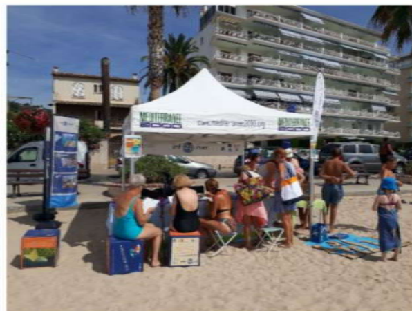
- Golfe Juan -

On ne le sait que trop : la mer peut être le réceptacle de nombreuses pollutions provenant des activités qui s'y pratiquent, mais aussi celles venant du bassin versant. En été, l'accroissement de la population (x8) nécessite une sensibilisation accrue des usagers pour préserver les espaces marins et littoraux. C'est ce que s'efforce de mettre en œuvre « Ecogestes Méditerranée » qui s'adresse en priorité aux pratiquants d'activités nautiques et notamment aux plaisanciers pour les inciter à adopter des pratiques respectueuses de l'environnement, à la fois en terme d'équipement et de comportement. Actions pédagogiques complétées par celles d'« Inf'eau mer ». L'association cannoise propose aux collectivités une action concrète de sensibilisation et d'information du grand public sur les enjeux liés à la mer et au littoral.