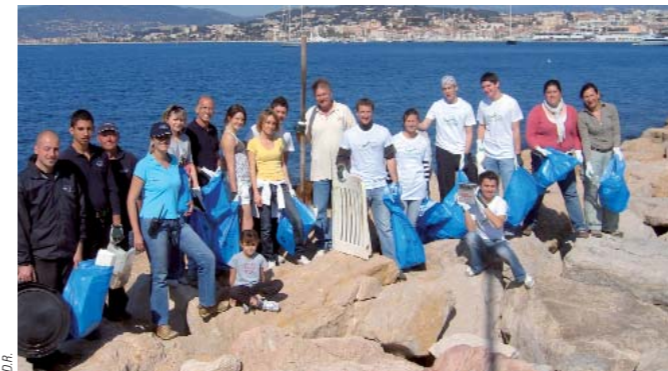
D.R. Dans le cadre de la Semaine du développement durable, des bénévoles se sont mobilisés pour débarrasser les rochers de la grande digue du port Pierre Canto d'une quantité impressionnante de déchets.

Géré à l'échelle internationale par une association non gouvernementale à but non lucratif, la FEE (Foundation for environmental education), le Pavillon bleu a