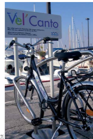
D.R. Vél'Canto, des vélos en libre-service.

vu le jour en France en 1985 à l'initiative de la branche française de cette organisation, l'OFFEEE (Office français de la fondation pour l'éducation à l'environnement en Europe). Le Pavillon bleu récompense plus de 3 300 plages et ports de plaisance dans 36 pays répartis en Europe, au Maroc, en Afrique du Sud, au Canada, en Nouvelle-Zélande et dans les Caraïbes. Cet écolabel permet de sensibiliser et de motiver les collectivités locales afin qu'elles prennent en compte le critère "environnement" dans leur politique de développement économique et touristique en complément et en renforcement des directives obligatoires. Il favorise aussi une prise de conscience générale envers un comportement plus respectueux de la nature et de ses richesses. L'environnement reste une affaire de volonté : on a constaté qu'en 1976, 35 % des points d'eau ana-